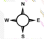
СХЕМА ІНЖЕНЕРНОГО ЗАБЕЗПЕЧЕННЯ ТЕРИТОРІЇ М 1:1 000