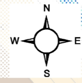
СХЕМА ІНЖЕНЕРНОЇ ПІДГОТОВКИ, БЛАГОУСТРОЮ ТЕРИТОРІЇ ТА ВЕРТИКАЛЬНОГО ПЛАНУВАННЯ М 1:1 000