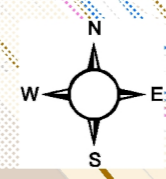
СХЕМА ІНЖЕНЕРНОГО ЗАБЕЗПЕЧЕННЯ ТЕРИТОРІЇ М 1:1.000