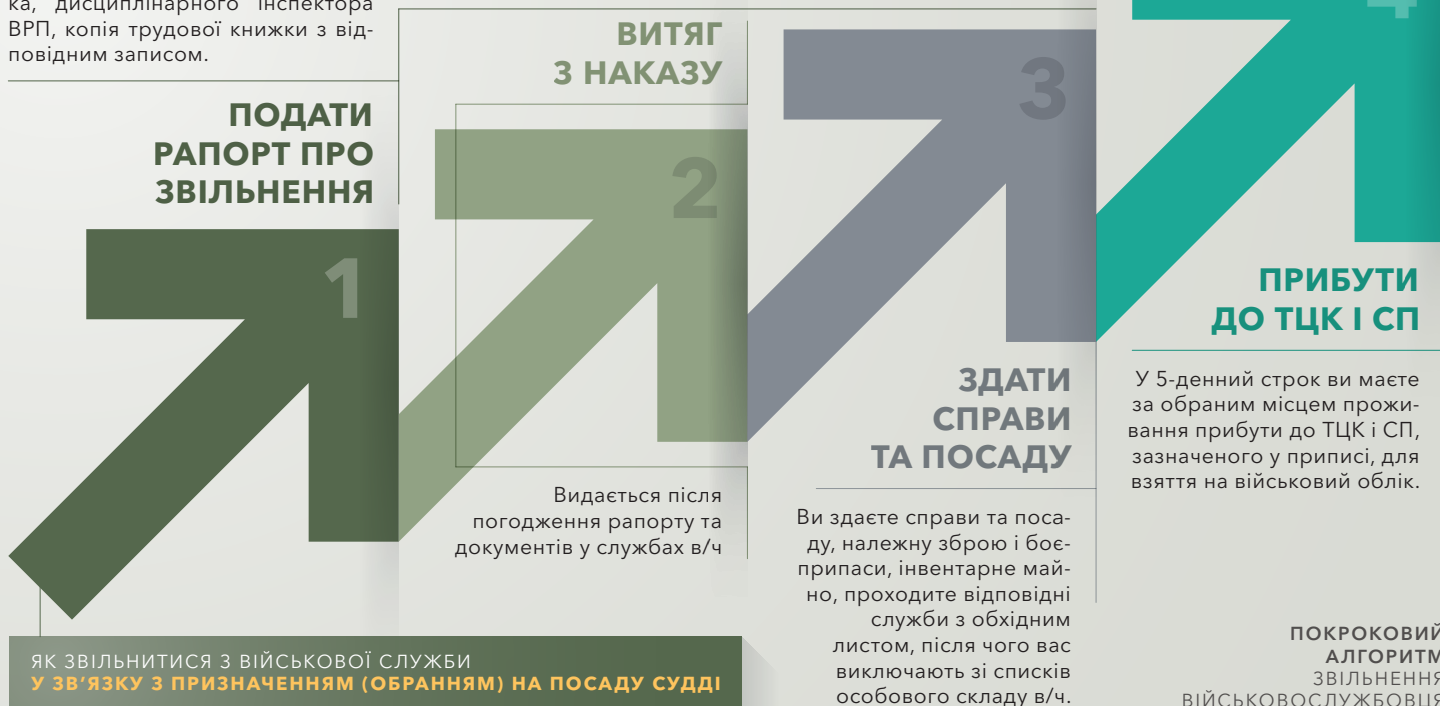
ІЛЮСТРАЦІЯ 8. АЛГОРИТМ ЗВІЛЬНЕННЯ З ВІЙСЬКОВОЇ СЛУЖБИ У ЗВ'ЯЗКУ З ПРИЗНАЧЕННЯМ НА ПОСАДУ СУДДІ

В/с має подати рапорт безпосередньому командирі. У рапорті описати вищезазначені наявні обставини. До рапорту слід додати документи. В даному випадку це можуть бути копії сторінок паспорту, витяг з наказу про призначення (обрання) на посаду судді, судді Конституційного Суду України, члена ВРП, члена ВККСУ, керівника служби дисциплінарних інспекторів ВРП, його заступника, дисциплінарного інспектора ВРП, копія трудової книжки з відповідним записом.