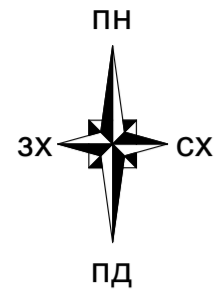
Схема інженерної підготовки території та вертикального планування М 1:500